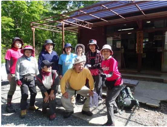
一ノ瀬までバスで来た