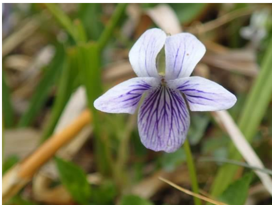
オオバタチツボスマレ