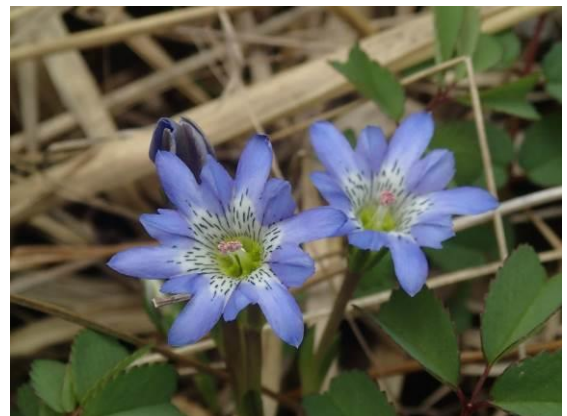
タテヤマリンドウ